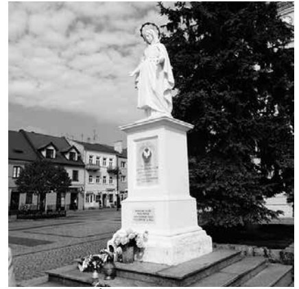
Figura Matki Bożej z Łęczycy

Państwo polskie odrodziło się dzięki ofiarności całego społeczeń-