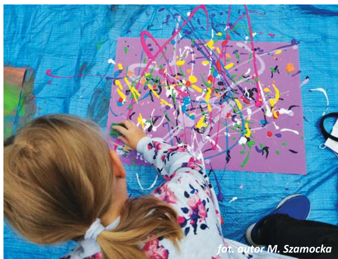
fot. autor M. Szamocka

W kolejnych latach edukacji dzieci niestety zaczynają wątpić czy to co zrobiły – narysowały, namalowały – jest dobre, oczekują jasnej instrukcji. Poruszają się schematycznie: wszystko musi być przedstawione realistycznie, bo w szkołach nie dopuszczamy abstrakcji u dzieci, ani tego że mogą myśleć abstrakcyjnie. A przecież one przede wszystkim tak myślą! Nie trzeba olbrzymich nakładów, można przy użyciu skromnych środków tworzyć instalacje, kolaże i złożyć nowy obiekt z czegoś co jest już gotowe, więc odpada problem związany z plastycznymi zdolnościami. dokończenie na str. 12