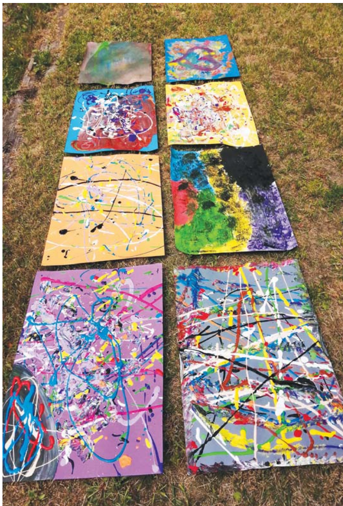
fol. autor M. Szamocka