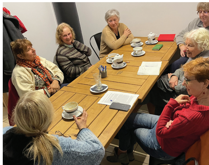
Zespół redakcyjny w trakcie warsztatów dziennikarskich