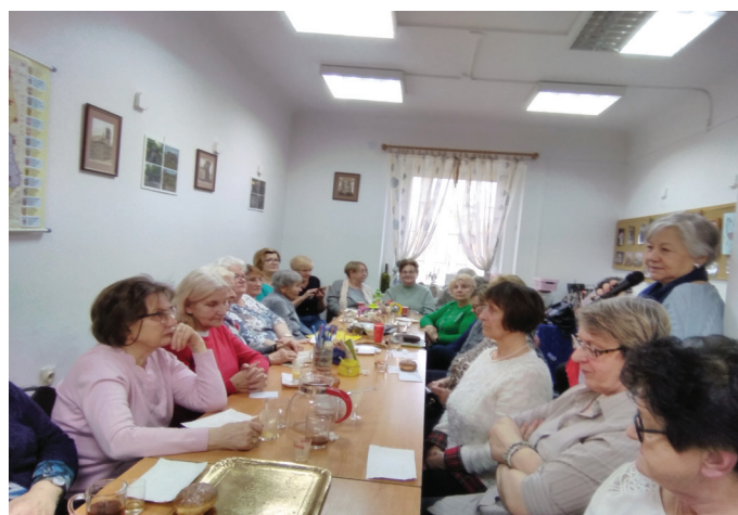
Spotkanie Seniorów – dyskusja przy pączku