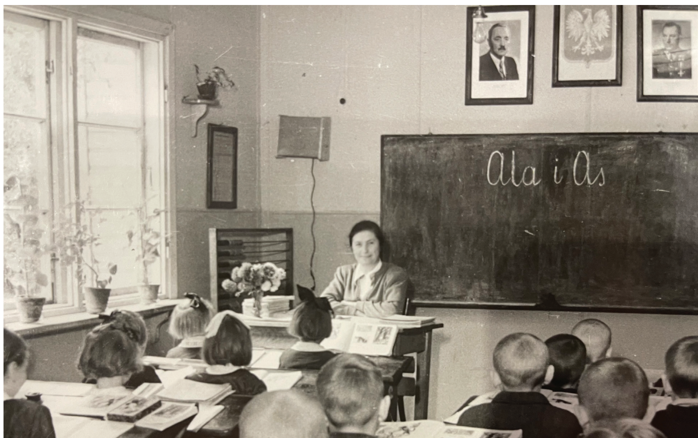
Zdjęcie z lat pięćdziesiątych, ze szkolnej kroniki